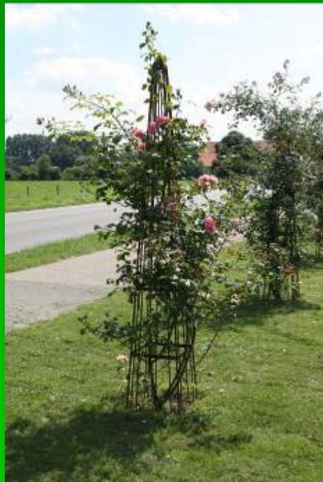
Pyramide carrée en 230cm de hauteur.

Nous pouvons vous présenter divers modèles de fabrication artisanale en fer plein. Ceux-ci sont livrés bruts mais peuvent également être galvanisés et ou laqués en diverses couleurs.