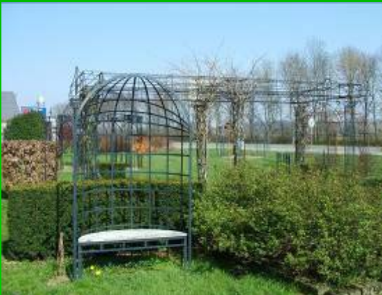
Niches livrables avec ou sans banc.