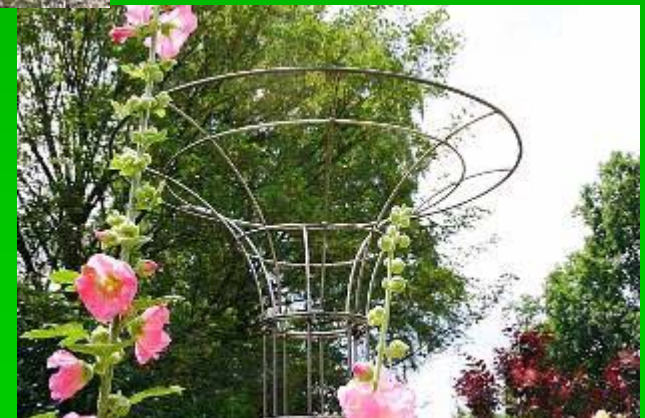
Support colonnaire en entonnoir. H. : 160 ou 250cm.

Garden Center P. Coquette Av. de la Forêt de Soignes 349-355 1640 Rhode-Saint-Genèse Tél. : 02.358.11.77 www.coquette.be