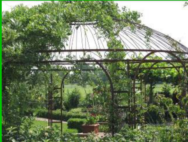
Gloriote 013 : diam. : 4 mètres

Quant aux arches et tonnelles, elles guideront vos pas vers une chambre de verdure, un coin du jardin ou accompagneront vos visiteurs jusqu'à la porte d'entrée en les enivrant du parfum des grimpantes qui les escaladent allègrement. Les gloriottes, kiosques ou tonnelles, composent la tendance classique de ce que l'on appelle des « chambres de verdure ». Un peu rétro, ces petits espaces de tranquillité et d'ombre correspondent à un jardin classique et très soigné.