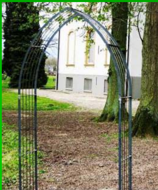
Arches rondes : 130cm, 150cm, 190cm, 230cm de largeur; hauteur 240 à 260cm.