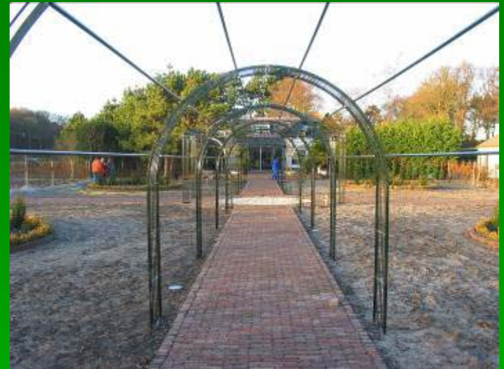
Arches: 130cm, 150cm, 190cm, 230cm de large

Les arches permettent également de créer des petites gloriettes à base carrée (voir photo)