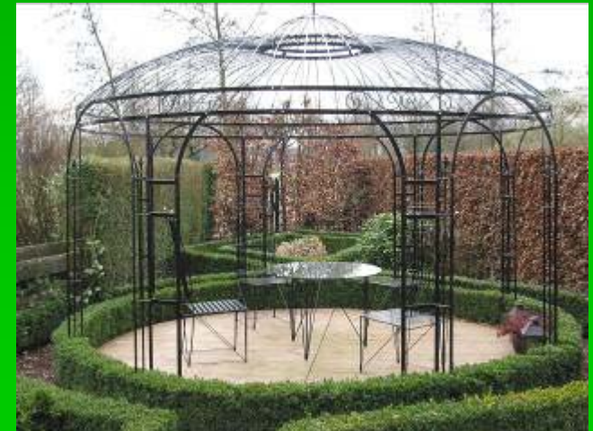
Gloriote 010 : diam. : 3.30 mètres