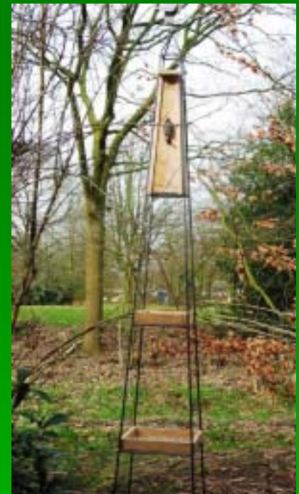
Combiné nichoir, mangeoire et abreuvoir montés dans une obélisque de 220cm de hauteur, laquée noire.