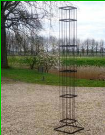
Colonne carrée en 270cm de hauteur