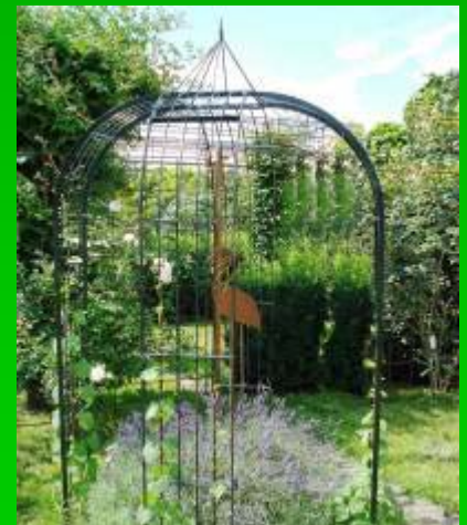
Gloriette à base carrée livrable en 150, 190, 230cm de largeur

Garden Center P. Coquette Av. de la Forêt de Soignes 349-355 1640 Rhode-Saint-Genèse Tél. : 02.358.11.77 www.coquette.be